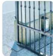
Gato DRIVE 700 con centralita externa instalada