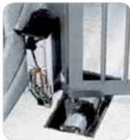
Instalación gato y centralita - vista interior