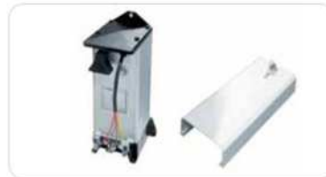
Centralita hidráulica y cubierta en aluminio anodizado con llave cifrada para acceso interno