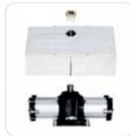
Abrazadera, caja y gato con freno